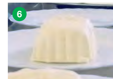
Maslo se pobere iz pinje in vstavi v modele.