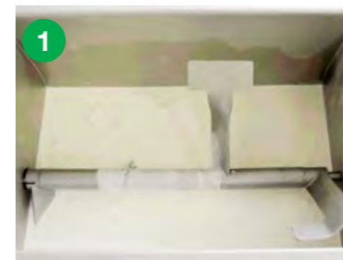
Zorjena smetana se nalije v pinjo.