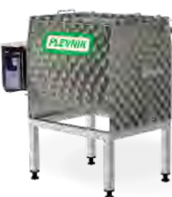
Stabilni podstavek za: PJ13, 25, 50, 100

Olajšano delo s pinjo zaradi višje delovne višine (900 mm). Enostavno premikanje s prevoznim podstavkom.