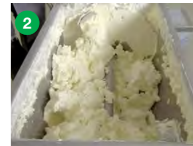
Stanje po 10 minutah mešanja pri visoki hitrosti.