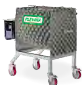
Prevozni podstavek za: PJ13, 25, 50