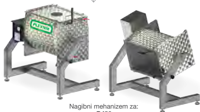
Nagibni mehanizem za: PJ50

Omogoča zvrčanje pinje za lažje praznjenje in pranje (odtekanje).