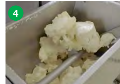
Maslo se izpira z vodo, dokler ta ne priteče ven čista.