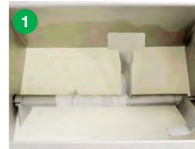
Zorjena smetana se nalije v pinjo.