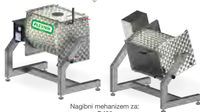
Nagibni mehanizem za: PJ50