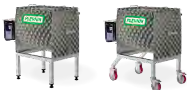
Stabilni podstavek za: PJ 25, 50, 100

Omogoča zvrčanje pinje za lažje praznjenje in pranje (odtekanje).