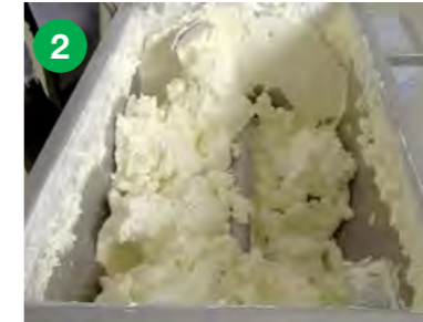
Stanje po 10 minutah mešanja pri visoki hitrosti.