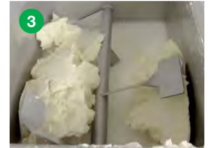
Po 20 minutah se izloči pinjenec, ki izteče skozi iztočni ventil.