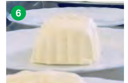
Maslo se pobere iz pinje in vstavi v modele.