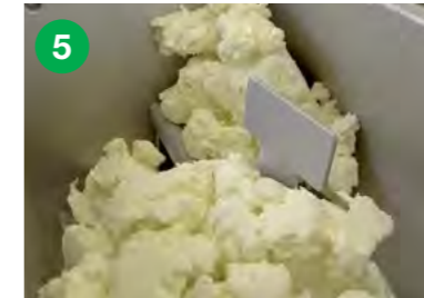
Stanje po 25 minutah mešanja. Maslo je narejeno.